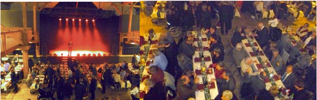
2010 25 ème anniversaire de la Clinique Le Noirmont. Au menu de la soirée récréative : bonne humeur, musique et repas de gala.