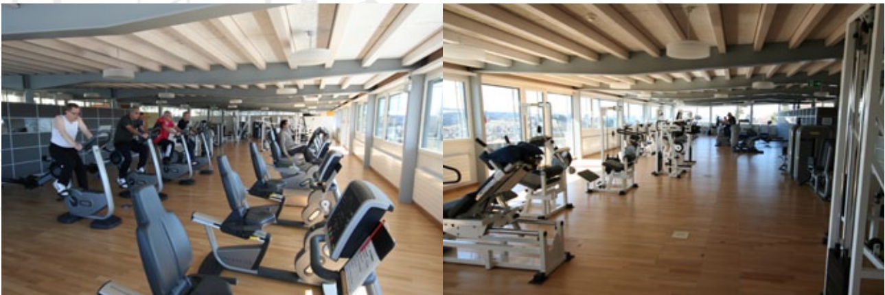
2011 Construction du Pavillon du mouvement. Ce remarquable plateau de réadaptation de 750 m 2 , unique en son genre en Suisse, nous permet aujourd'hui de répondre de manière optimale à la prise en charge de toutes les catégories de patients, du sportif à la personne âgée et dépendante.