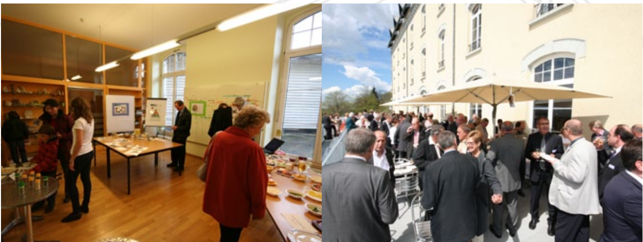
2012 L'opération portes-ouvertes du 5 mai 2012 a rencontré un très grand succès populaire, avec plus de 2'000 visiteurs.